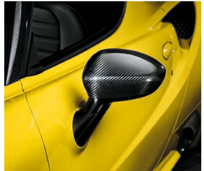
4YD - CALOTTE SPECCHIETTI IN FIBRA DI CARBONIO