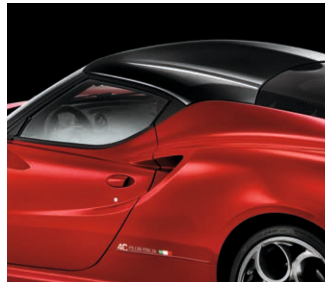
4GS - TETTO IN CARBONIO