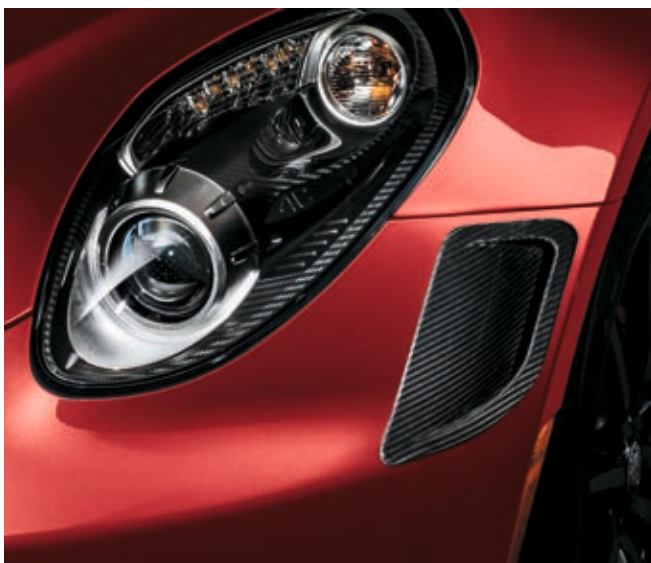
230 - FARI BI-XENON / 7ZL - PRESE D'ARIA ANTERIORI IN CARBONIO