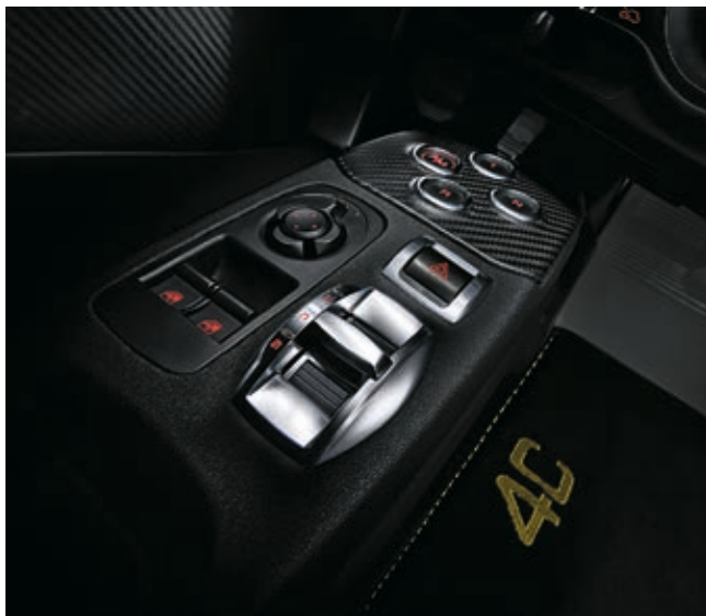
5EP + 6AW - INSERTO CRUSCOTTO E PLANCIA COMANDI IN CARBONIO