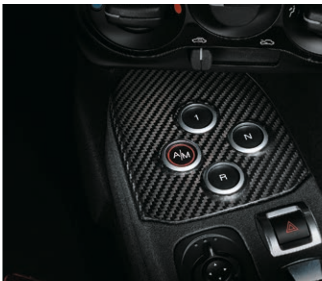
5EP + 6AW - INSERTO CRUSCOTTO E PLANCIA COMANDI IN CARBONIO