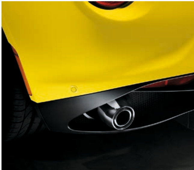
947 - SCARICO SPORT CON DUE TERMINALI CROMATI