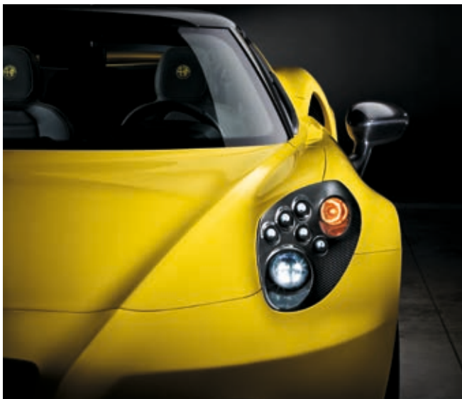
74M - FARI BI-LED / 5IF - CALANDRA FARI IN CARBONIO