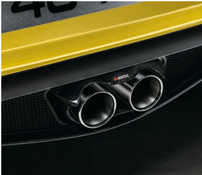
81E - SCARICO RACING AKRAPOVIC CON FUNZIONE DUAL MODE