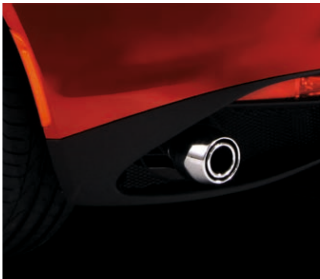
947 - SCARICO SPORT CON DUE TERMINALI CROMATI