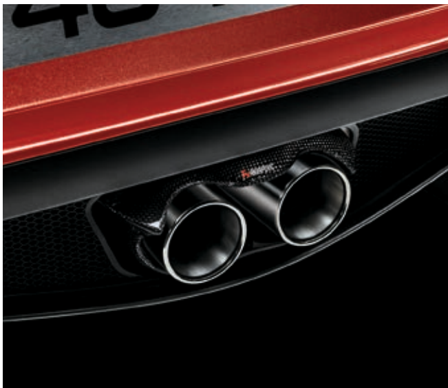
81E - SCARICO RACING AKRAPOVIC CON FUNZIONE DUAL MODE